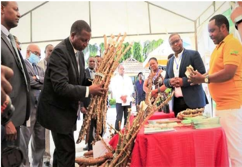
Waziri wa kilimo Mhe. Prof. Adolf Mkenda akipata maelezo ya mbegu bora za muhogo katika Mkutano wa Wadau wa Kilimo cha Muhogo Tanzania uliofanyika tarehe 7 Mei, 2021 Jijini Dodoma

142. Mheshimiwa Spika , uzalishaji wa muhogo mkavu umeshuka kutoka tani 2,728,031 mwaka 2018/2019 hadi tani 2,427,190 mwaka 2019/2020 kutokana na mvua nyingi ambazo ziliathiri ukuaji wa zao hilo. Aidha, hadi Aprili 2021, upatikanaji wa vipando bora vya muhogo umefikia pingili 40,960,500 ikilinganishwa na pingili 30,492,830 za mwaka 2019/2020.