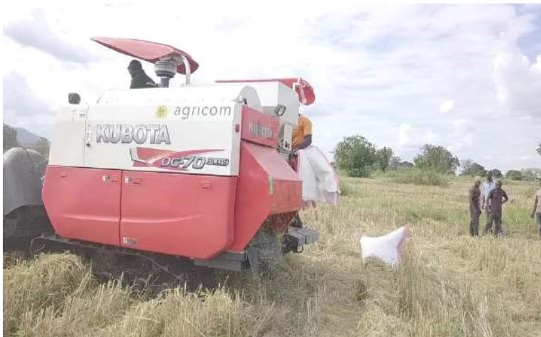
Uvunaji wa zao la mpunga kwa kutumia zana bora

136. Mheshimiwa Spika , uzalishaji wa mpunga umeongezeka kutoka tani 3,174,766.153 mwaka 2018/2019 hadi tani 4,673,969.231 mwaka 2019/2020. Ongezeko hilo limetokana na uhamasishaji wa matumizi ya kanuni bora za kilimo, teknolojia bora za uzalishaji, usimamizi baada ya kuvuna pamoja na uimarishwaji wa miundombinu ya umwagiliaji.