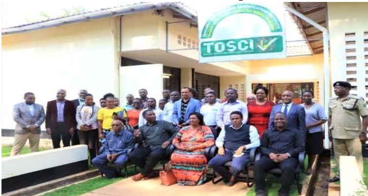
Kamati ya Bunge ya Kilimo, Mifugo na Maji ilipotembelea Taasisi ya Udhibiti na Uthibiti wa ubora wa mbegu TOSCI.