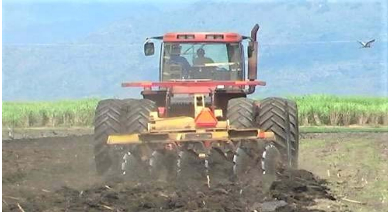
Matumizi ya trekta katika maandalizi ya shamba la miwa - Kilombero

kipindi hicho sekta binafsi imeingiza nchini matrekta makubwa 1,124 na matrekta madogo ya mkono 459 na hivyo kufanya idadi ya matrekta makubwa kuwa 19,212 na matrekta madogo ya mkono 9,342.