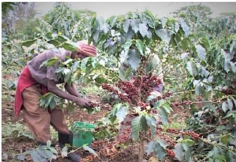
Kahawa bora aina ya Arabika katika Wilaya ya Hai – Kilimanjaro

106. Aidha, katika msimu wa 2020/2021 Alliance for Coffee Excellence (ACE) kwa kushirikiana na Portland Global Initiative na wawekezaji wenye mashamba makubwa wilayani Karatu (Ngorongoro Coffee Group) waliandaa na kuendesha mashindano ya kupata kahawa bora. Mashindano hayo yalikusisha wazalishaji wa mashamba makubwa sita ambao waliwasilisha sampuli kutoka kwenye lot 40 zilizoandaliwa kwa njia sita tofauti ambapo lot 26 zilipata alama zaidi ya 80. Kahawa hizo ziliuzwa kwa njia ya mnada ( online auction ) na katika mnada huo kahawa yenye ubora wa juu zaidi kutoka shamba la Acacia ilishindaniwa na kununuliwa kwa bei ya juu zaidi ya Dola za Marekani 143.3 kwa kilo. Aidha, katika mnada huo makampuni zaidi ya 28 yalishiriki kununua kahawa iliyozalishwa Tanzania kutoka kwenye mataifa ya Marekani (USA), South Korea, Canada, Hong Kong, Thailand, Falme za Kiarabu, Belgium, Taiwan, Greece, Japan na Kuwait. Mnada huo uliuzwa kahawa yenye uzito wa kilogramu 6,380.475 na kuingiza Dola za Marekani 120,500.46.