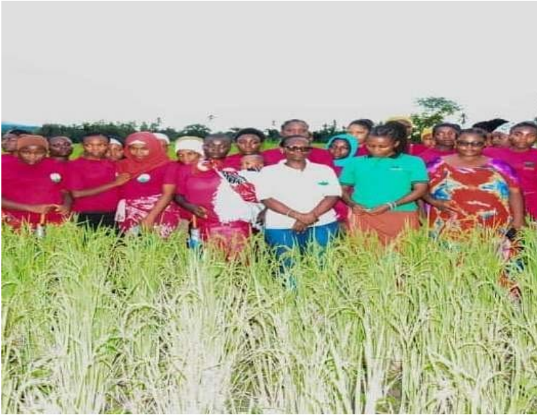
Kikundi cha wasichana “Malkia wa Nguvu” Mang’ula – Morogoro wanaojishughulisha na kilimo cha mpunga

163. Mheshimiwa Spika , Wizara kwa kushirikiana na Shirika la Kimataifa la Heifer imetoa mafunzo kuhusu kilimo biashara cha mbogamboga na matunda, minyororo ya thamani ya mazao ya kilimo, akiba na mikopo, uongozi kwa viongozi wa Vyama vya Ushirika vya vijana; matumizi ya teknolojia za kielektroniki kwenye kupata taarifa za masoko, na programu ya uanagenzi ( Apprenticeship ) kwa vijana 3,807 (Me 1,905 na Ke 1,902) katika Mikoa ya Mbeya, Songwe, Njombe na Iringa. Aidha, vituo atamizi ( incubation centers ) vinne (4) vimeanzishwa katika mikoa ya Mbeya, Iringa, Njombe na Songwe kwa lengo la kuwajengea vijana ujuzi wa kilimo cha mazao ya bustani ambapo kituo kimoja cha Mbeya kimeanza kufanya kazi.