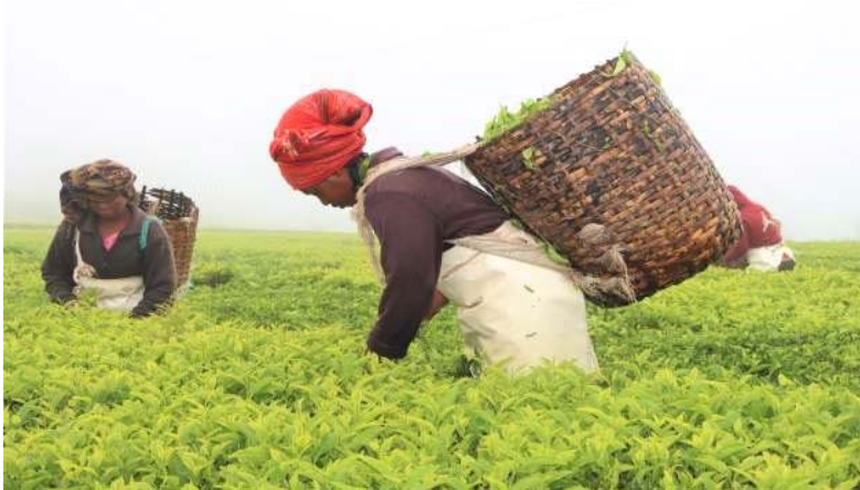
Uvunaji wa Majani ya Zao la Chai

112. Mheshimiwa Spika , Wizara kupitia Taasisi ya Utafiti wa Chai Tanzania ( Tea Research Institute of Tanzania - TRIT ) inaendelea kutekeleza mpango kabambe wa kuhaulisha teknolojia za uvunaji chai kwa njia ya mashine ili kukabiliana na uhaba wa nguvukazi unaoanza kujitokeza kwenye kilimo cha chai. Mpango huo ni sehemu ya utekelezaji wa mradi wa Agri-connect unaofadhiliwa na Jumuiya ya Ulaya (EU). Utafiti wa mashine hizo unaendelea katika Wilaya ya Rungwe ambapo mashine 30 za uchumaji wa chai ( motorized hand plucking machines ) zimenunuliwa na kusambazwa katika vikundi vya wachumaji kwa lengo la kuangalia ufanisi wake.