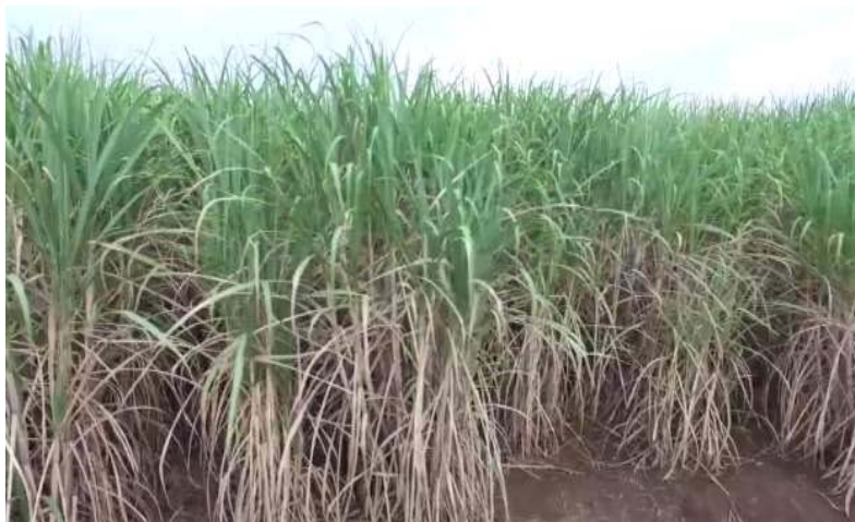
Shamba la miwa - Mtibwa

114. Mheshimiwa Spika , hadi Aprili 2021, uzalishaji wa sukari ulikuwa tani 361,474.37 sawa na asilimia 95.74 ya lengo la kuzalisha tani 377,527. Uzalishaji huo umeongezeka kwa asilimia 16 ikilinganishwa na tani 311,357.61 zilizozalishwa mwaka 2019/2020. Kati ya mwezi Julai 2020 na Januari 2021 bei ya sukari ya jumla ilishuka kutoka Shilingi 2,526 hadi Shilingi 2,388 kwa kilo na bei ya rejareja kutoka Shilingi 2,847 hadi Shilingi 2,687 kwa kilo.