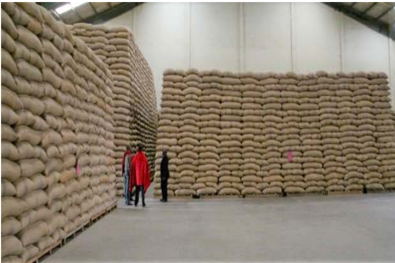
Hifadhi ya nafaka katika ghala linalomilikiwa na Wakala wa Taifa wa Hifadhi ya Chakula Nchini (NFRA)

22. Mheshimiwa Spika , Wizara kupitia Wakala wa Taifa wa Hifadhi ya Chakula ( National Food Reserve Agency - NFRA ) imeendelea kuimarisha hifadhi ya chakula nchini ambapo katika mwaka 2020/2021, Wakala umenunua tani 58,813.401 za nafaka zikiwemo tani 51,832.502 za mahindi, 850.908 za mtama na tani 6,129.991 za mpunga. Kiasi hicho cha nafaka pamoja na akiba ya tani 52,724.73 za nafaka ya mwaka 2019/2020 zimefanya wakala kuwa na jumla ya tani 110,389.057 ya akiba katika ghala zake ( Kiambatisho Na 2 ). Hadi Aprili 2021 akiba iliyopo kwenye ghala za Wakala ni tani 109,231.057 baada ya mauzo ya tani 1,167.