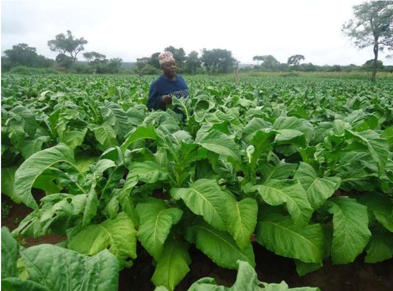
Shamba la tumbaku - Tabora

101. Mheshimiwa Spika , katika kipindi hicho, ekari 123,131 zimepandwa tumbaku sawa na asilimia 113.5 ya lengo la ekari 108,482. Pia, miche ya miti 20,362,656 ya kukaushia tumbaku ya wakulima imeoteshwa ikilinganishwa na lengo la miti 24,321,795. Aidha, Bodi ya Tumbaku imekagua mabani ya kisasa 94,663 ya kukaushia tumbaku kati ya mabani 134,881 na kubainika kuwa yanakidhi vigezo.