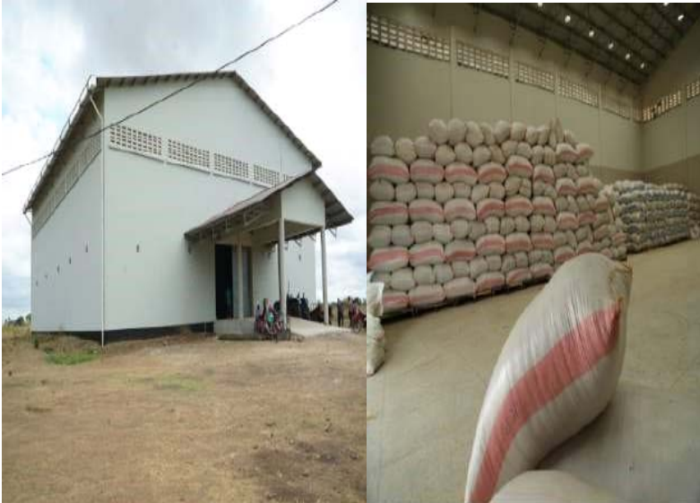
Ghala la Mvumi Mpunga uliohifadhiwa katika ghala la Mvumi

49. Mheshimiwa Spika , Wizara kupitia mradi wa ERPP unaotekelezwa mkoani Morogoro imekamilisha ujenzi wa ghala tano (5) zenye uwezo wa kuhifadhi jumla ya tani 6,700 za nafaka. Ghala hizo zimejengwa katika skimu za Msolwa Ujamaa (tani 1,700); Njage (tani 1,700); Mvumi (tani 1,300); Kigugu (tani 1,000); na Mbogo Komtonga (tani 1000). Ghala hizo zitatumwa na Vyama vya Umwagiliaji vya skimu za maeneo hayo chini ya usimamizi wa Halmashauri.