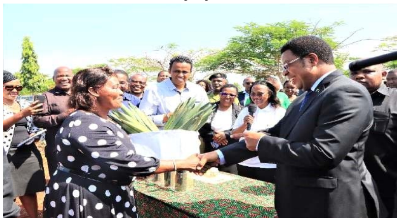
Waziri Mkuu Kassim Majaliwa akizindua zoezi la kugawa miche bora ya mkonge kwa wakulima wa Mkoa wa Tanga ikiwa ni mkakati wa Serikali kukuza zao hilo alipotembelea TARI Mlingano Januari, 2021.

123. Mheshimiwa Spika , ili kuongeza uzalishaji wa zao la mkonge, Wizara kupitia TARI imepanda hekta 35.4 za vitalu vya miche ya mkonge katika kituo cha TARI Mlingano (hekta 33.8), Halmashauri ya Wilaya ya Muheza (hekta 1.2) na Gairo hekta 0.4. Eneo hilo litawezesha upatikanaji wa miche 2,896,000 ya mkonge ambayo itatosheleza kupanda hekta 579.2. Vilevile, Wizara kupitia Bodi ya Mkonge imeanzisha kitalu cha hekta 3.75 katika shamba la Hale na shamba darasa katika Wilaya ya Butiama.